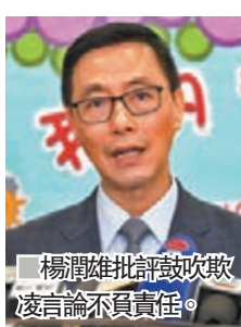
楊潤雄批評鼓吹欺凌言論不負責任。

近期有網民作恐嚇言論,揚言要到警員子女就讀學校「接放學」、「用麻包袋招呼」,有報指警方向有子女的警務人員派發「警報器」,緊急情況下即會發出警報聲響。楊潤雄表示留意到相關報道,對學生攜帶何物,則屬於家長及校方之間的協議,局方會交予個別學校處理。